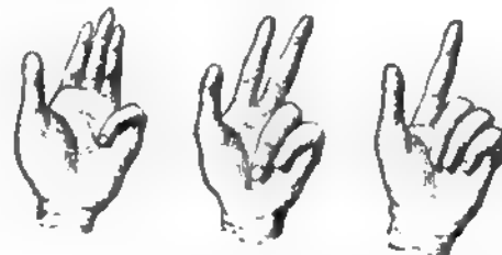
Семь. Восемь. Девять.

Обозначенія трехъ послѣднихъ чиселъ перваго десятка очень похожи на обозначенія трехъ первыхъ; существенное различіе заключается лишь въ томъ, что въ то время, какъ для условнаго изображенія чиселъ 1, 2 и 3 нѣкоторые пальцы только сгибались (см. фиг. 2), теперь для обозначенія чиселъ 7, 8 и 9 придется тѣ же пальцы загибать, какъ можно больше, на ладонь (см. фиг. 4).